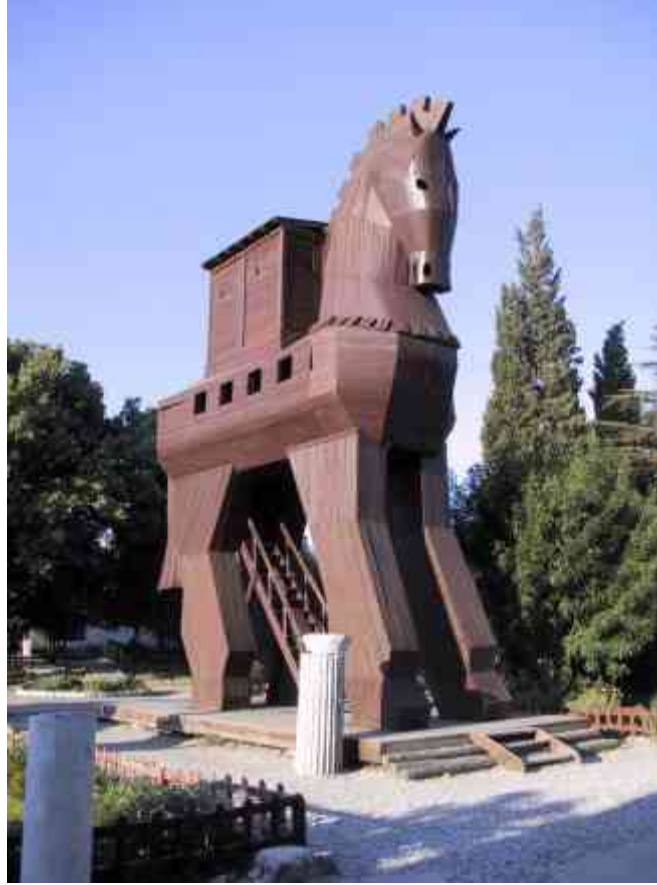
Troya Ören Yeri girişindeki Troya Atı