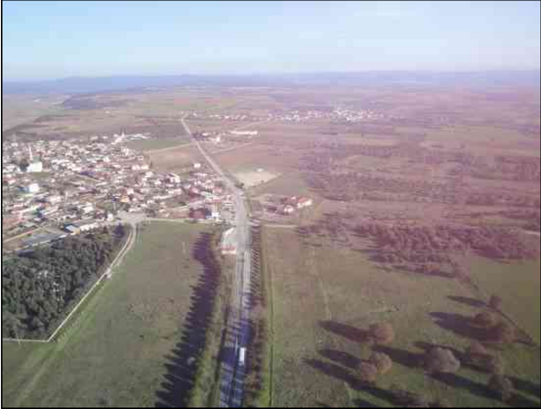
Tevfikiye Köyü ve Müze Alanı Hava Fotoğrafı

T.C. KÜLTÜR VE TURİZM BAKANLIĞI KÜLTÜR VARLIKLARI VE MÜZELER GENEL MÜDÜRLÜĞÜ