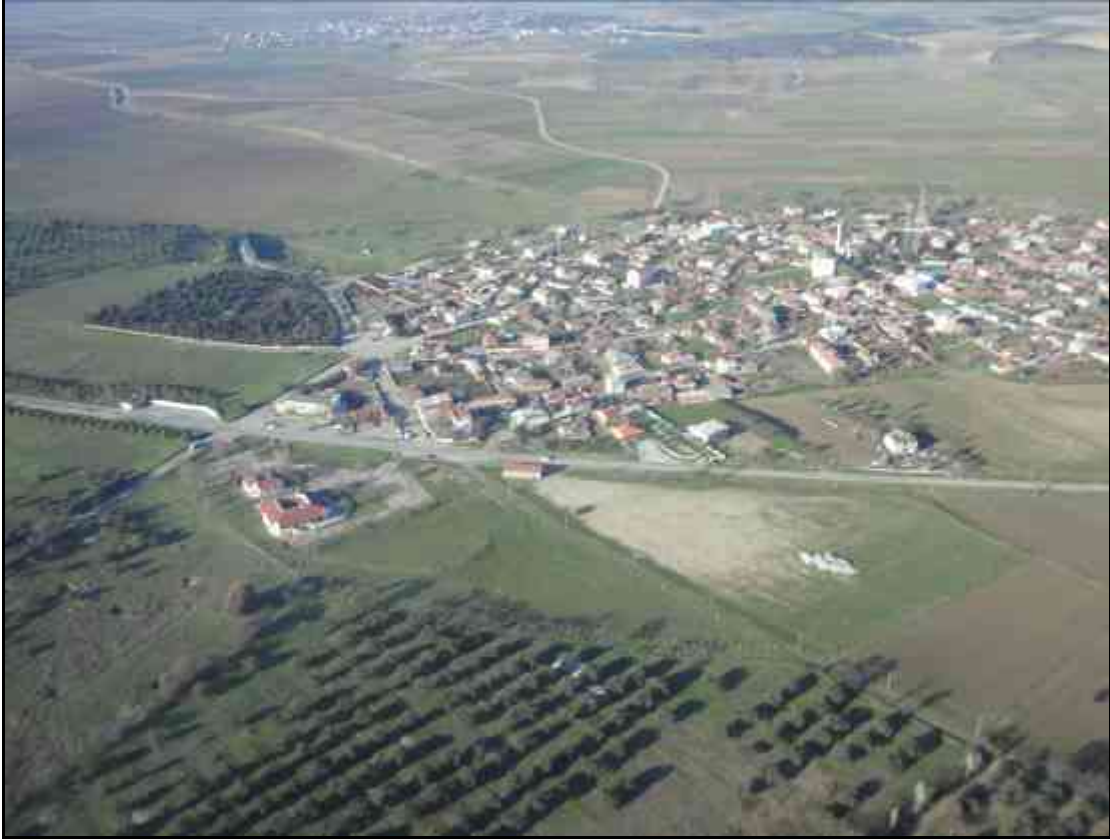
Tevfikiye Köyü ve Müze Alanı Hava Fotoğrafı

T.C. KÜLTÜR VE TURİZM BAKANLIĞI KÜLTÜR VARLIKLARI VE MÜZELER GENEL MÜDÜRLÜĞÜ