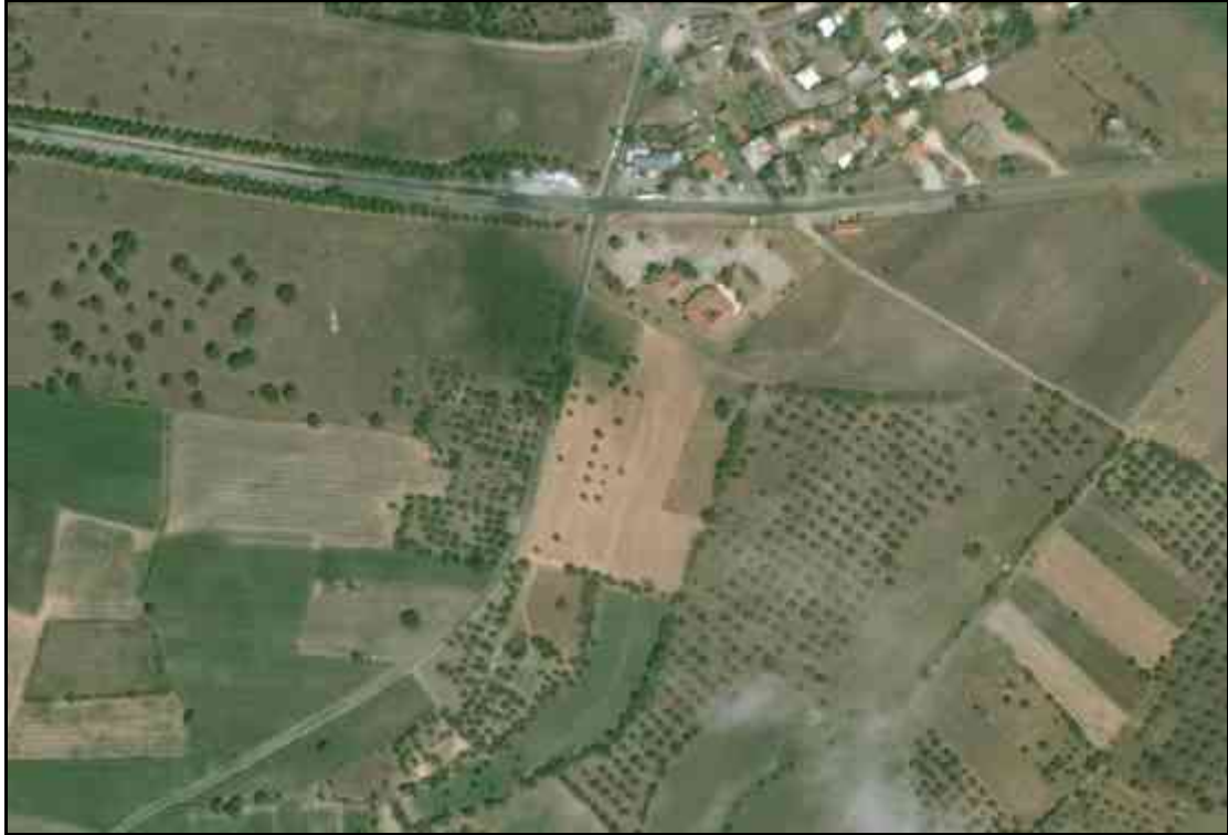
Müze Alanı Hava Fotoğrafı

T.C. KÜLTÜR VE TURİZM BAKANLIĞI KÜLTÜR VARLIKLARI VE MÜZELER GENEL MÜDÜRLÜĞÜ