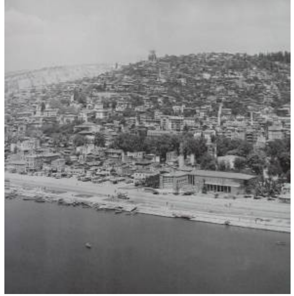
Resim 1, 2: 1960'lı yılların başında, E-5 karayolu yapıldıktan sonra İzmit