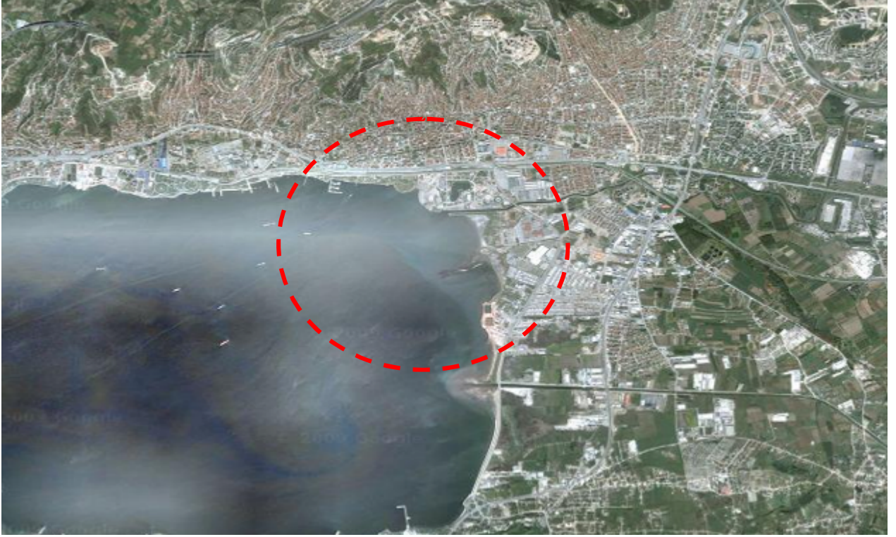
Resim 12: Yarışma Alanının Konumu