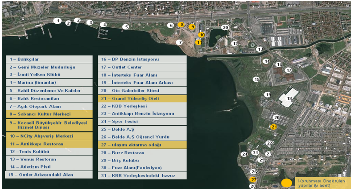
Resim 14: Yarışma alanında yer alan kullanımlar

Aşağıdaki haritada (Resim14) proje alanında yer alan mevcut kullanımlar gösterilmiştir.