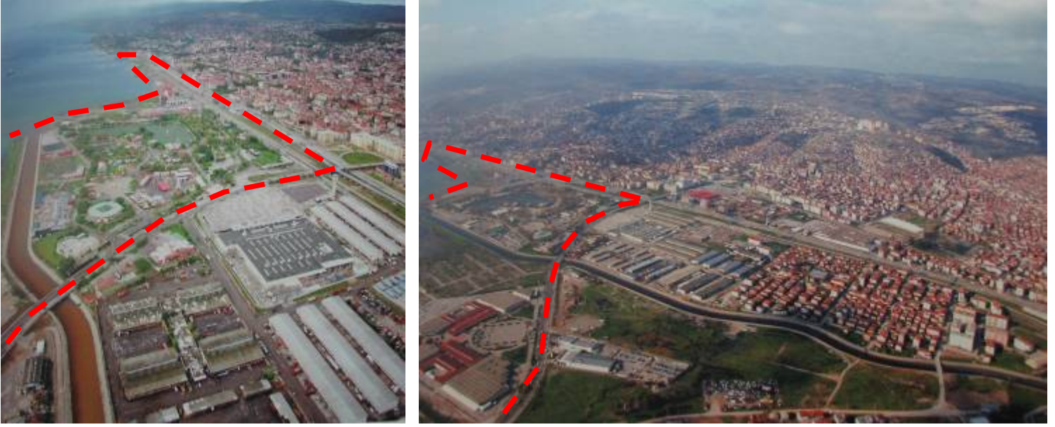
Resim 6, 7, 8, 9: 1972 ve 2001 yıllarında çekilmiş, yarışma alanının bir kısmını ve yakın çevresini gösteren fotoğraflar