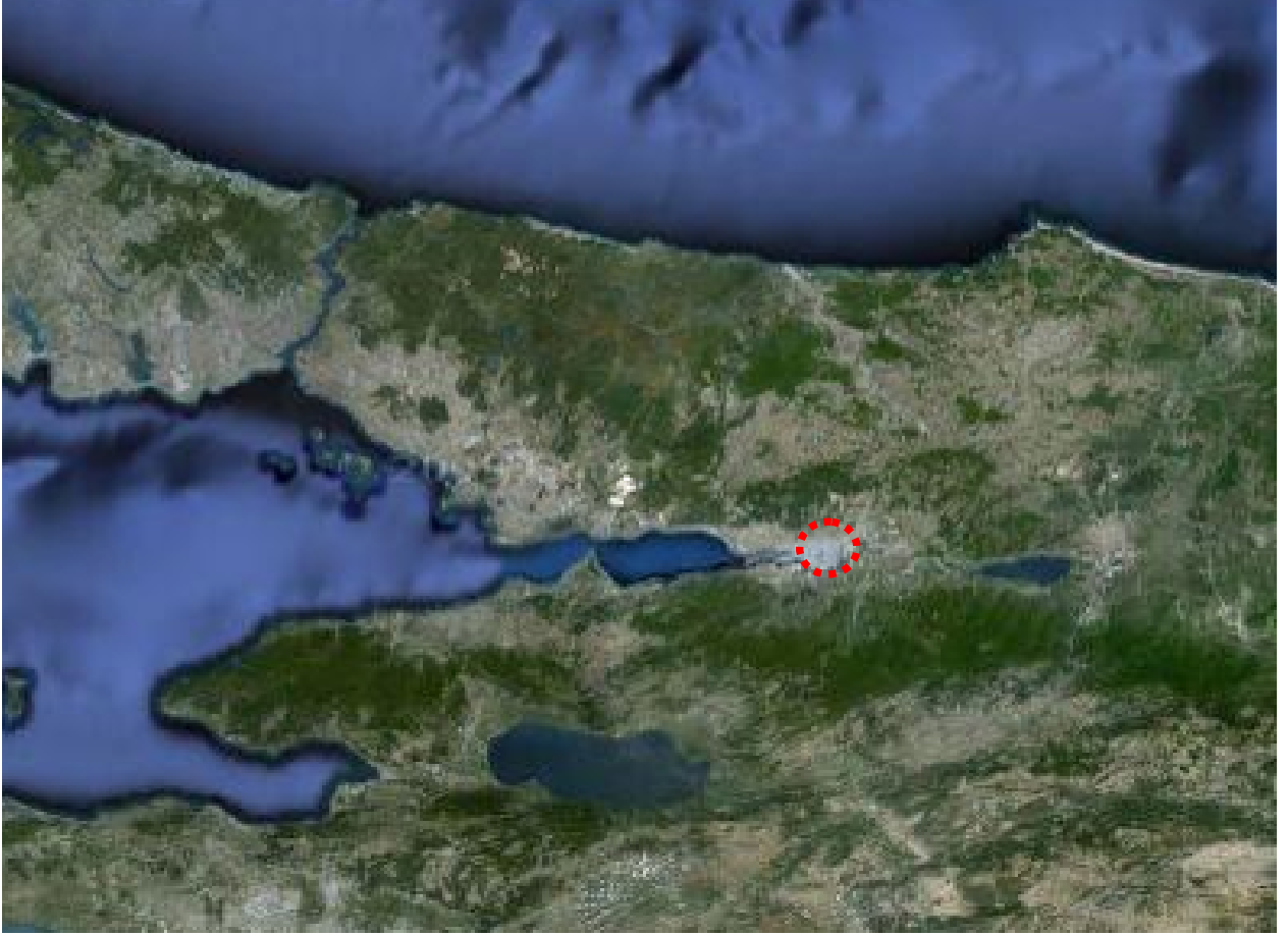
Resim 10: Yarışma Alanının Konumu