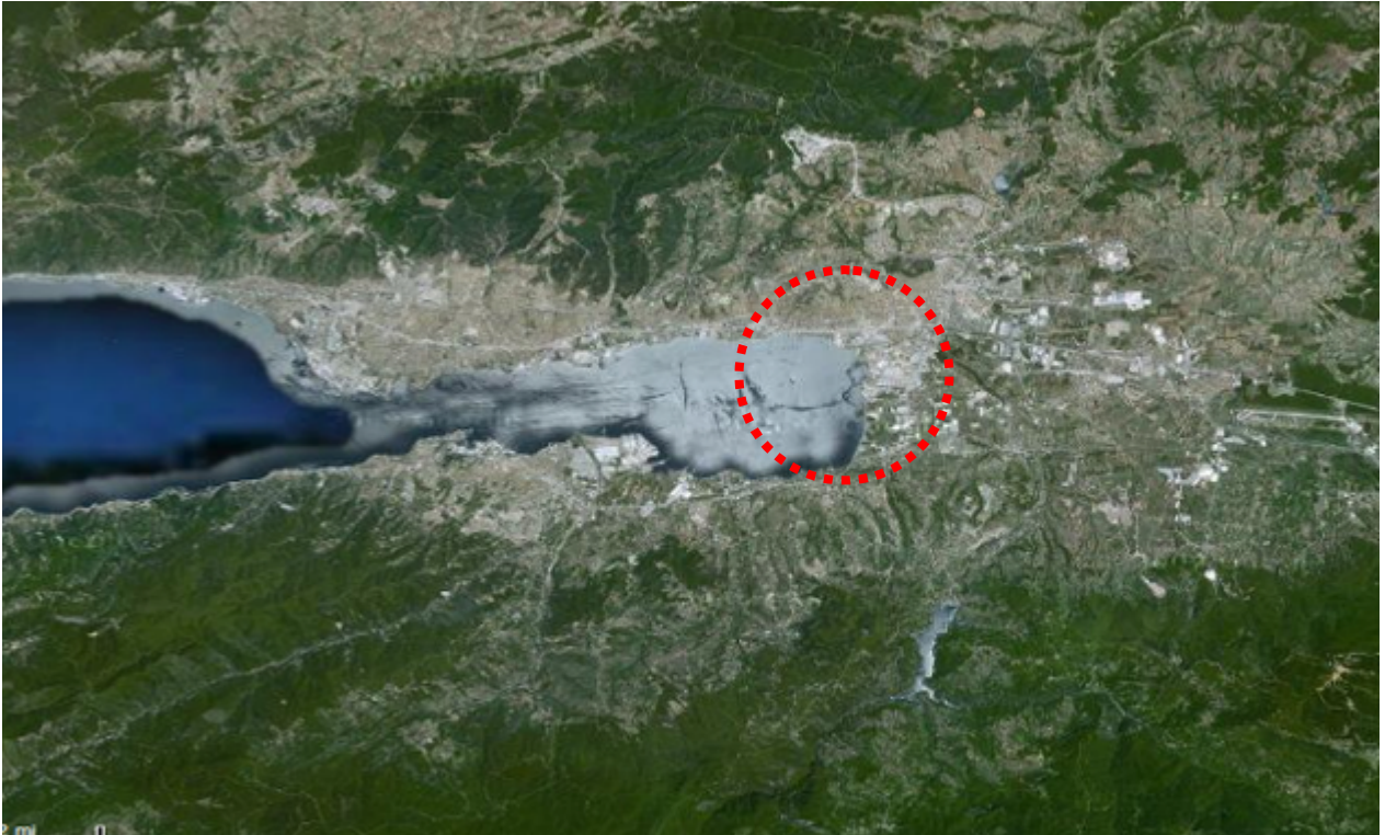
Resim 11: Yarışma Alanının Konumu