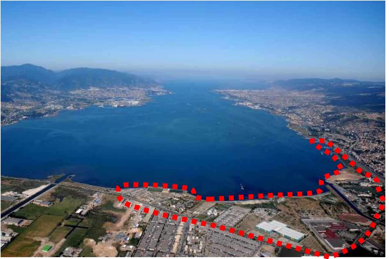
Resim 13: Yarışma alanı ve yakın çevresi