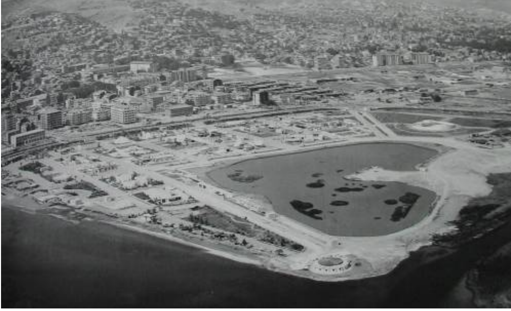
Resim 3, 4, 5: 1974 yılında çekilmiş Fuar Alanı'nın yıl içindeki gelişimini gösteren fotoğraflar

Alanın güneyinde yer alan kullanımlar genellikle 1999 depreminden sonra üniversitenin bu alanda yer seçmesi, depremzedelerin bu alanlara yerleştirilmesi ile oluşmuş, zaman içerisinde depremzedelerin yapımı biten kalıcı konutlara yerleştirilmesi, üniversitenin yeni bir alanda yer seçmesi ve binaların tamamlanıp, taşınması üzerine, dönüştürülmüş ya da el değiştirmiştir. Alanda yer alan Outlet Center 1997 yılında, İnterteks Fuar Alanı 1998 yılında, Grand Yükseliş Oteli 2002 yılında faaliyete geçmiştir.