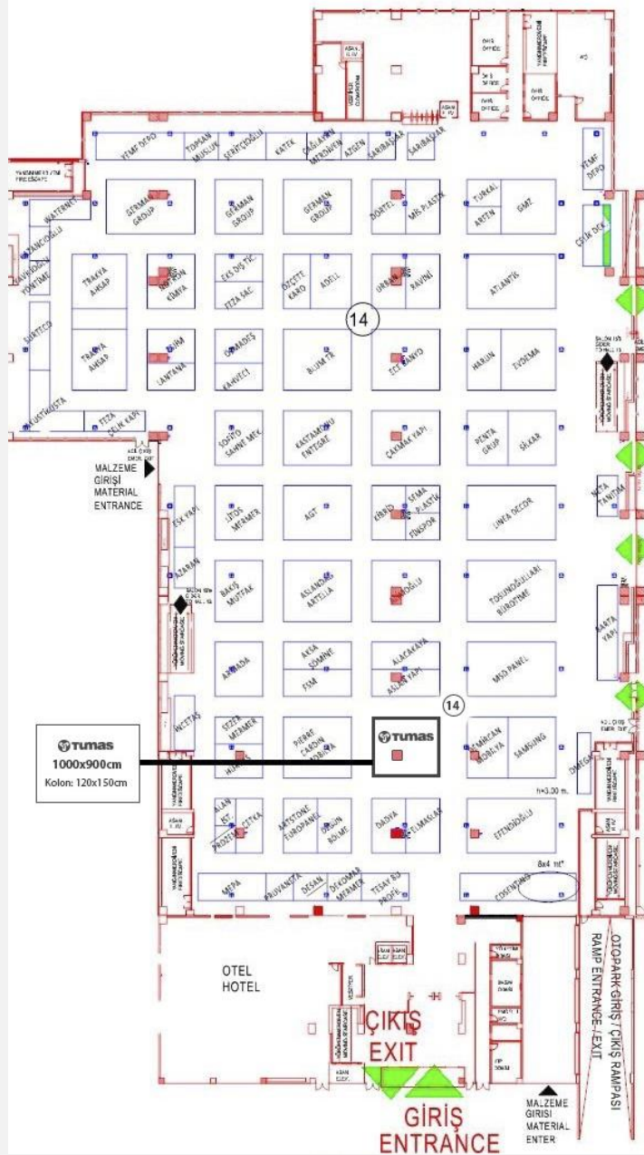
Şekil 2. Tumaş Mermer standının fuar alanındaki yerleşiminin teknik çizimi