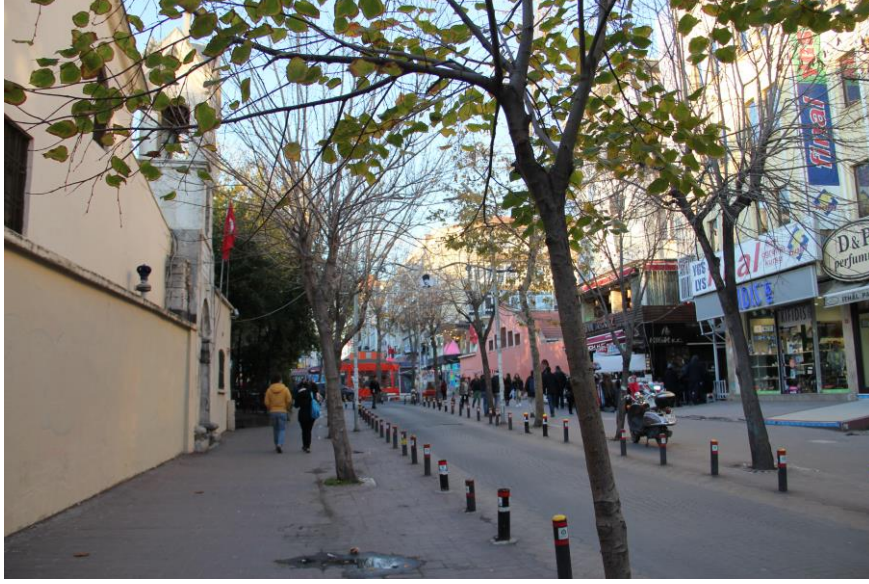
Resim 2. Ebuziyya Caddesi'nden Kiliselere doğru bakış