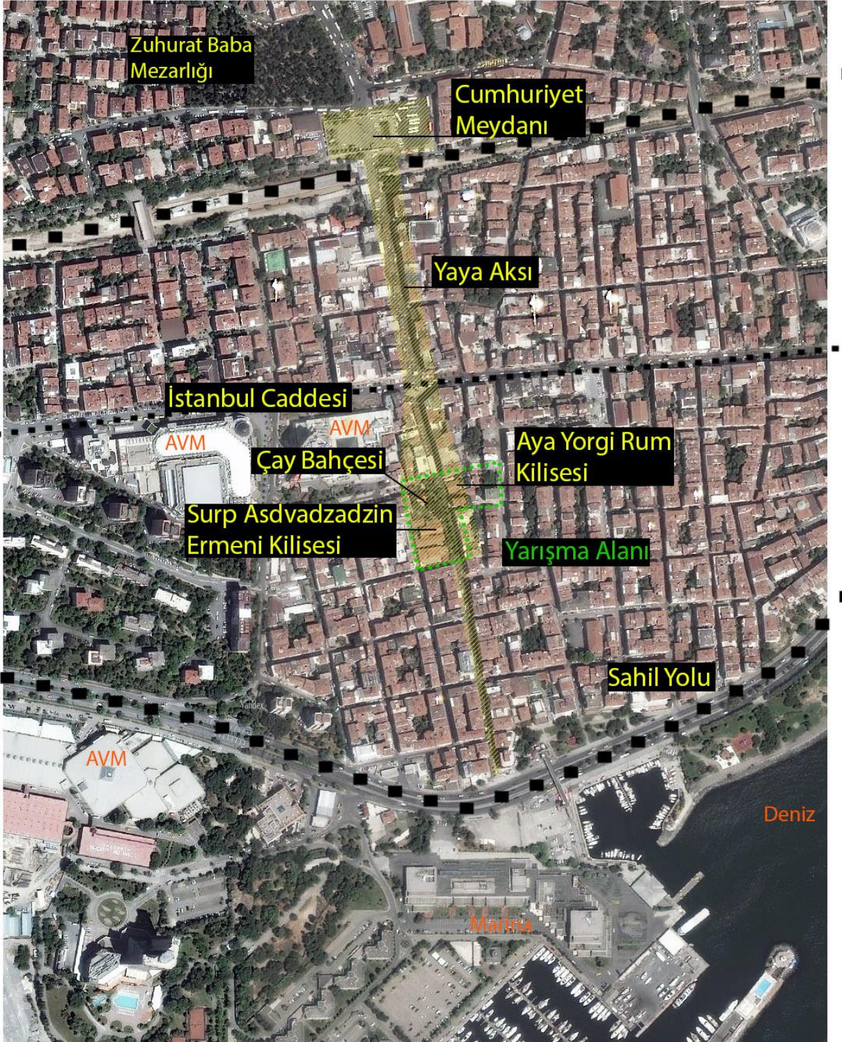
Resim 1. Alanın Bakırköy'deki Yeri. Cumhuriyet Meydanı ve Deniz Arasındaki Konumu.